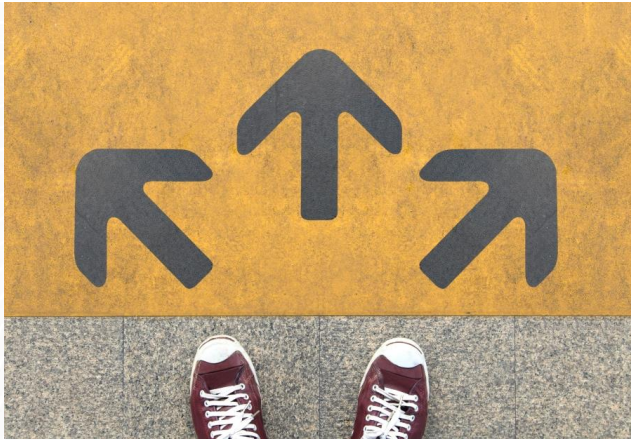
Kuva. Beaufort County School District