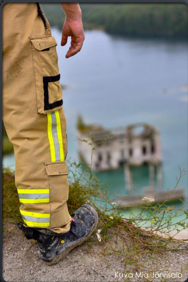
Kuva Mia Järvisalo