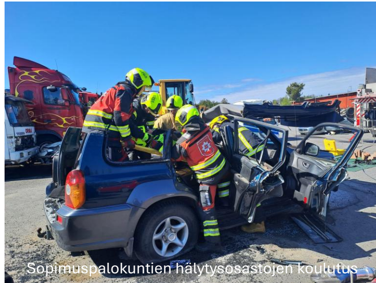
Sopimuspalokuntien hälytysosastojen koulutus